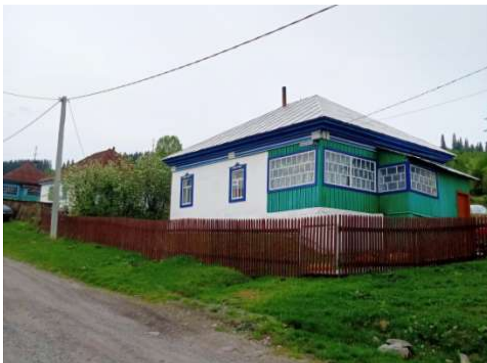
Дом №1, Дурновых (построен до 1960г.)