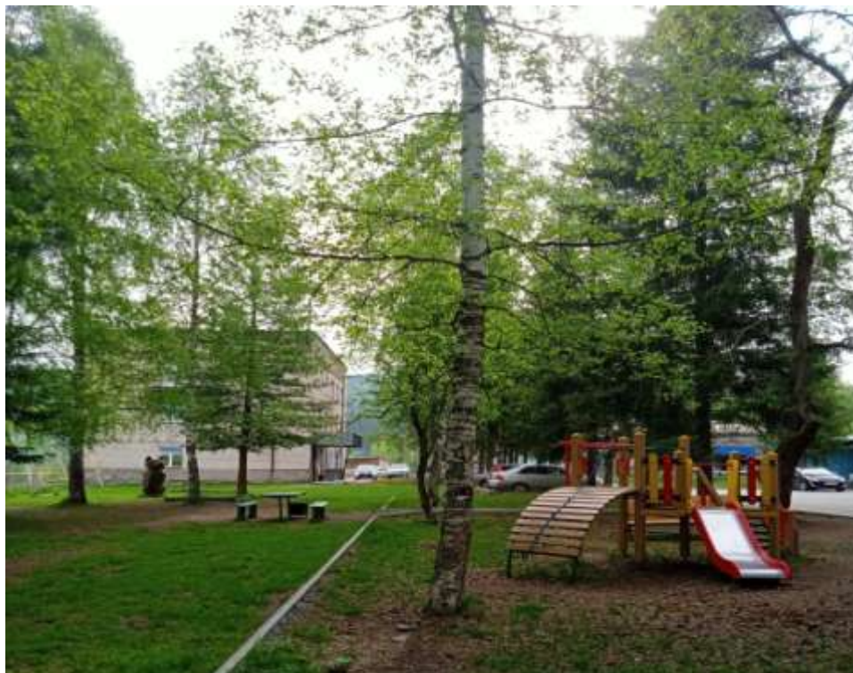
Управление МЧС, детская площадка