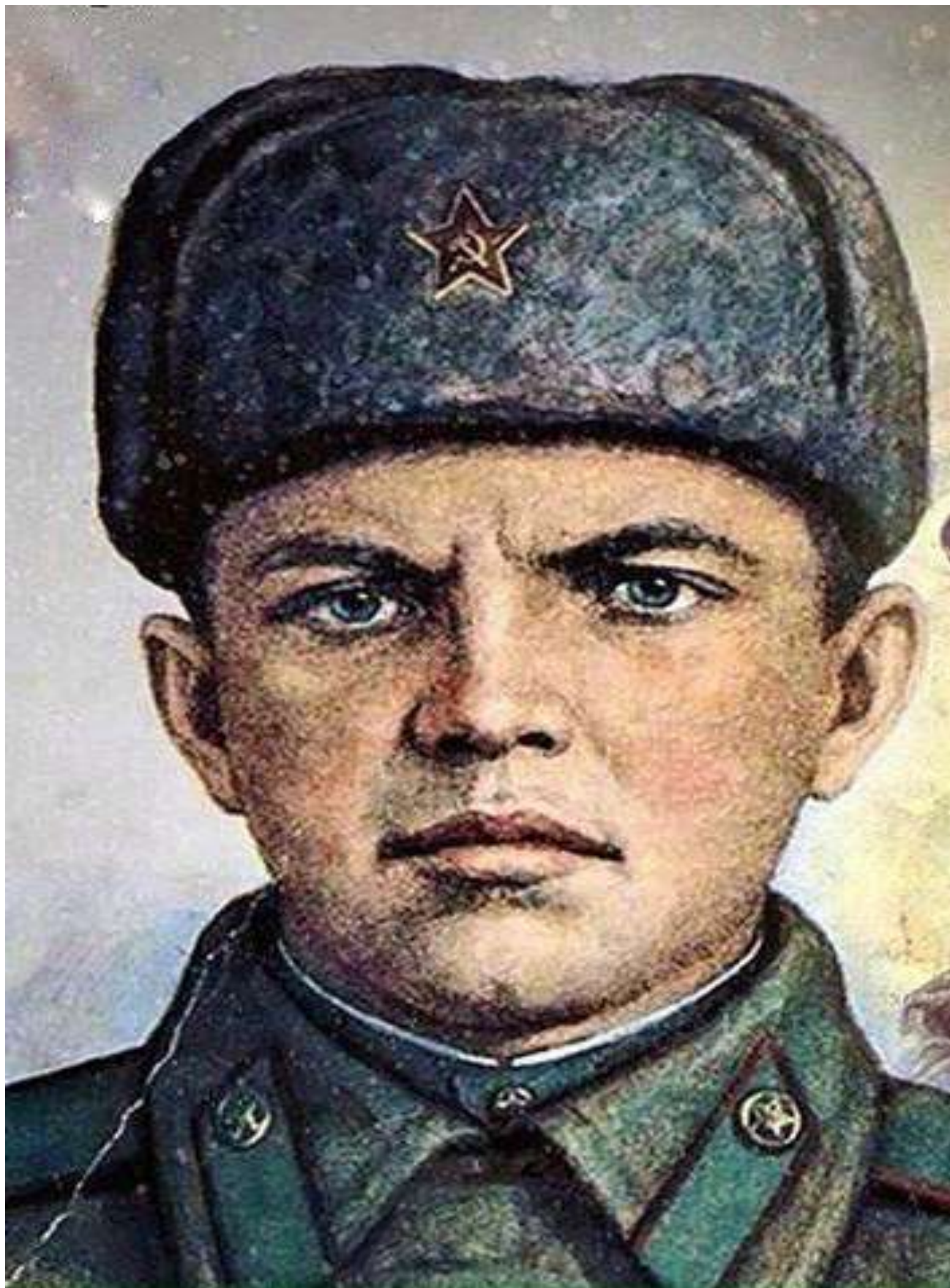
Матросов Александр Матвеевич (05.02.1924- 27.02.1943г.г.), Герой Советского Союза, гвардии рядовой