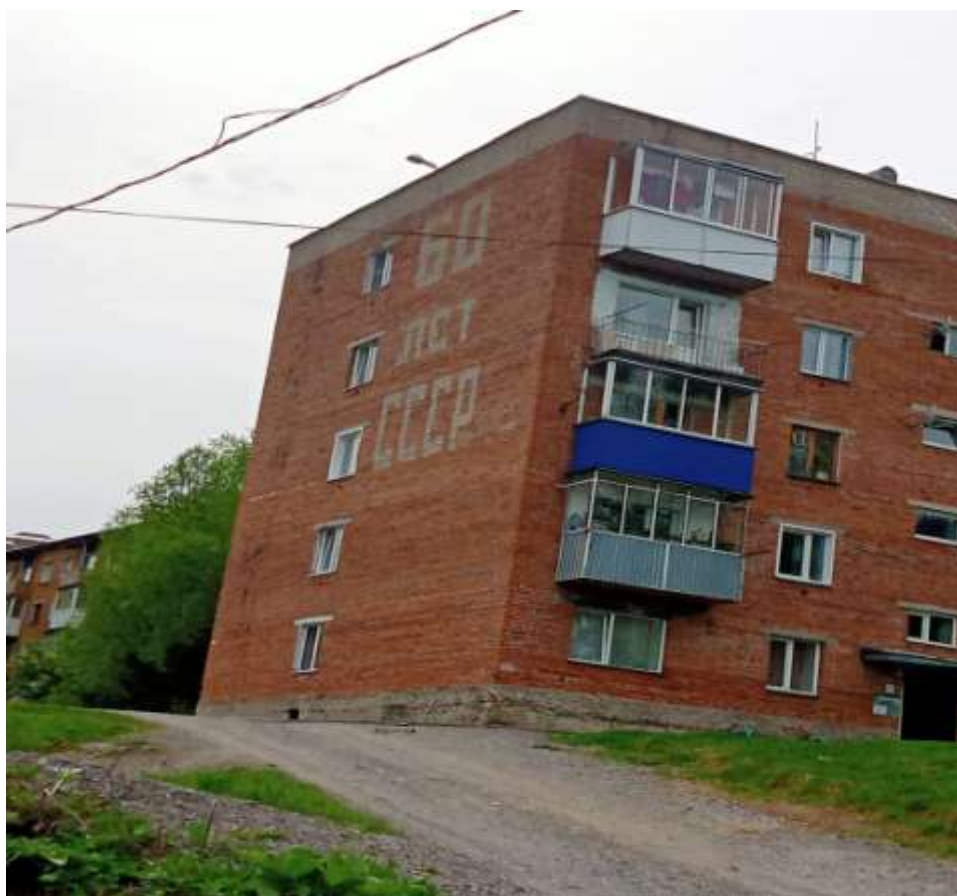
Дом построен в 1982г.